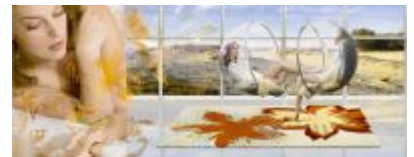
Karpi Home Fashion heeft nieuwe karpertjes met bijpassende poefs, kussens en plaids in vier verschillende thema's. Hier zien we Windflowers Rubial.