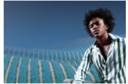
Deze jonge creatie van Van Besouw heeft een pool die wordt gevormd door een zware wollen ribbel. Sportief, robuust en eigentijds.

Hanneke vervolgt: „Karpertjes zijn het helemaal momenteel. Hiermee wordt een zacht eiland gecreëerd, waar men heerlijk de voeten in laat wegzakken. Pure ontspanning op hoogpolige kleden, die je een gevoel van wellness geven. Een hoge aalbaarheidsfactor is gewenst, men kiest voor zachte materialen en speelt met structuren. Mat en glans worden gecombineerd, waardoor het karpertje lijkt te leven. Het breekt de ruimte en geeft het geheel een bijzonder en persoonlijk sfeertje. Maar vlak een kamerbreed tapijt ook niet uit. Want, wist je dat je hiermee de kamer langer of breder kunt laten lijken? Net wat je wilt!”