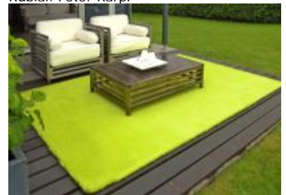
Met Freet in de tuin is het goed toeven! Dit kleurrijke outdoor carpet is ideaal voor decoratie van tuin, terras of balkon.