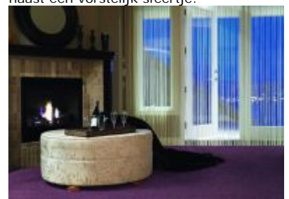
Parade Finesse voelt fluweelzacht aan